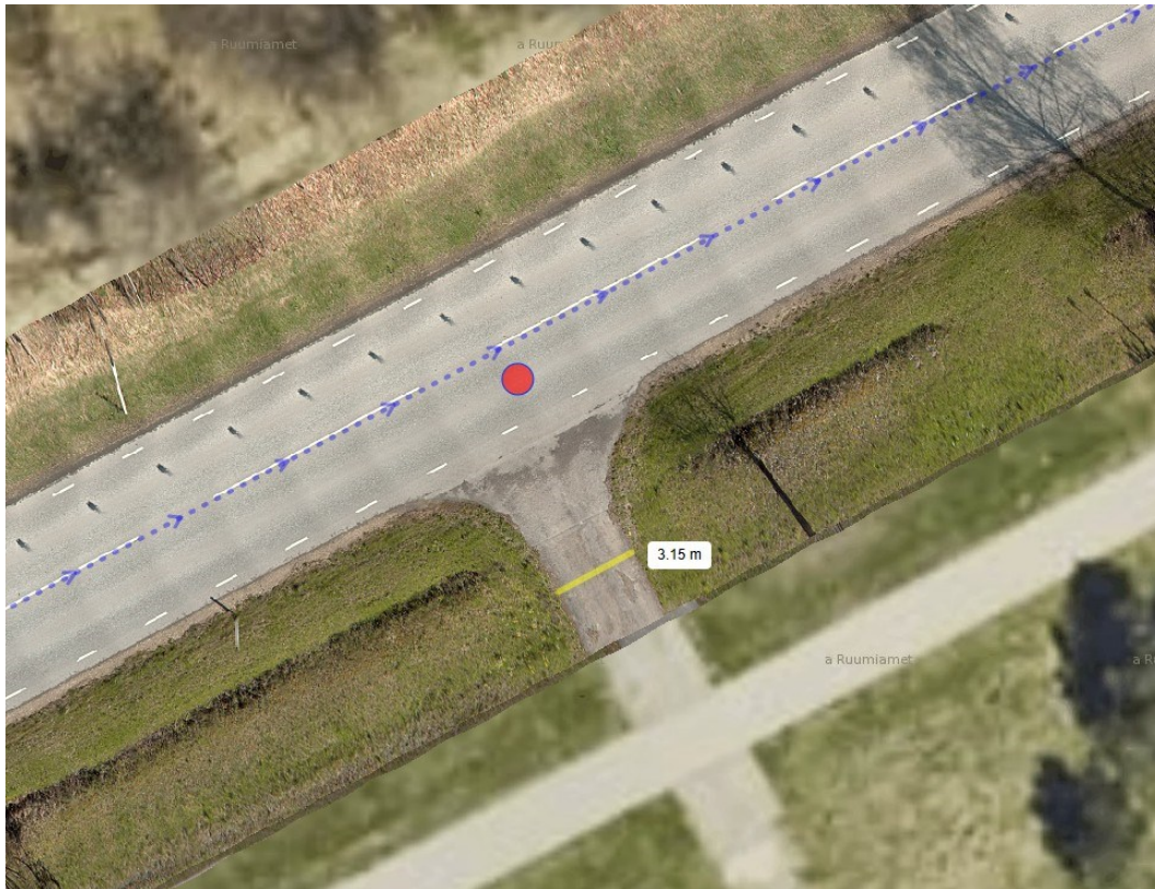
Joonis 1. Riigitee nr 21133 km 5,387 Vana-Nigula kinnistu juurdepääsutee laius, kuvatõmmis tänavavaatest seisuga aprill 2025

teostamiseks riigitee alusel maaüksusel, peab projektist olema selgelt ning üheselt mõistetavalt aru saada, millised tööd teostatakse kohaliku omavalituse poolt väljastatava ehitusloa alusel ning millised tööd vastavalt riigitee ristumiskoha ehitamise lepingule. Riigitee ristumiskoha ehitamise lepingut ehtisregistrisse mitte üles laadida.